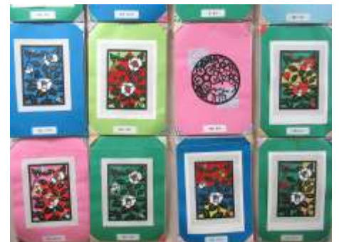
スマイル (認知症予防教室)