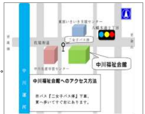
市バス「二女子」停より東へ約20m