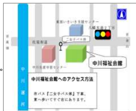
市バス「二女子」停より東へ約20m