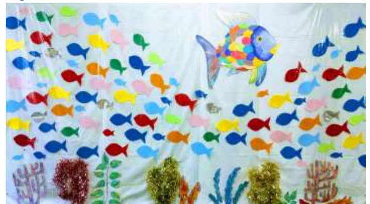
『にじいろのさかな』